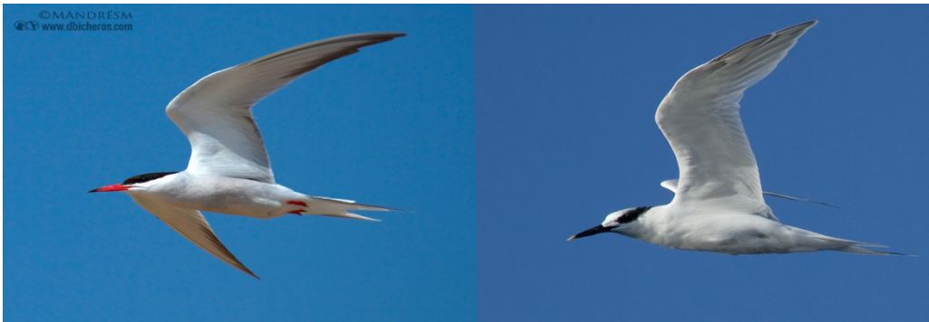
GOLONDRINAS DE MAR.