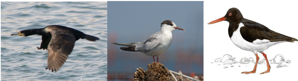
CORMORAN. CHARRAN COMÚN. OSTRERO.

Algunas aves en las cuales se han aislado subtipos de virus de influenza aviar.