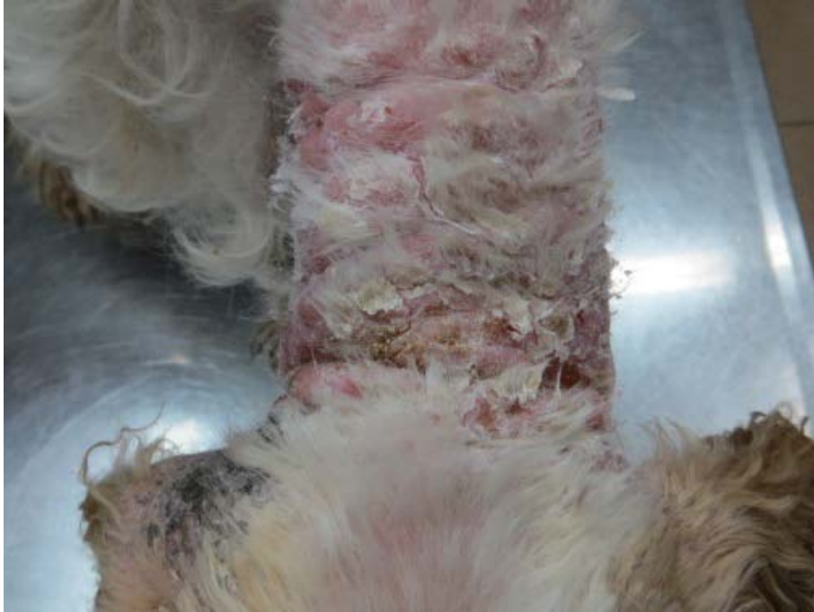
Piel de cuello: engrosamiento, inflamación severa, gran descamación, úlceras.

Todas las lesiones contaminadas severamente por gérmenes bacterianos y otras por gérmenes bacterianos y fúngicos que complicaban la enfermedad de base.