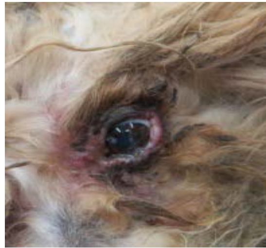
Afectación de bordes palpebrales y la piel de los mismos.