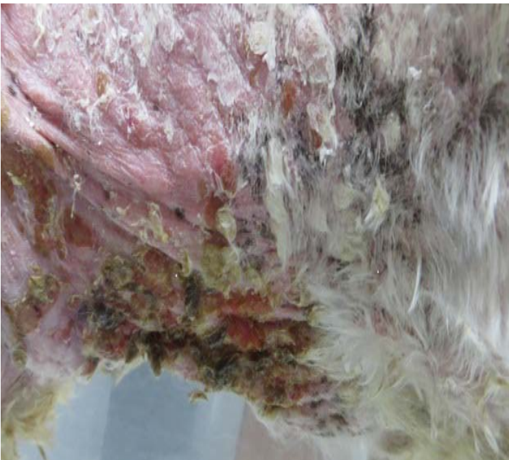
Piel ventral: úlceras, escoriaciones, descamación.