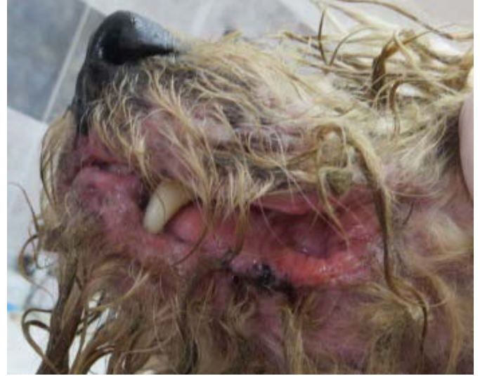
Depresión y letargo. Afectación de labios y mucosa oral: severa quilitis.