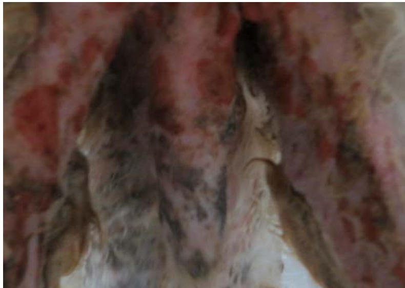
Piel ventral: úlceras, escoriaciones, descamación, costras.