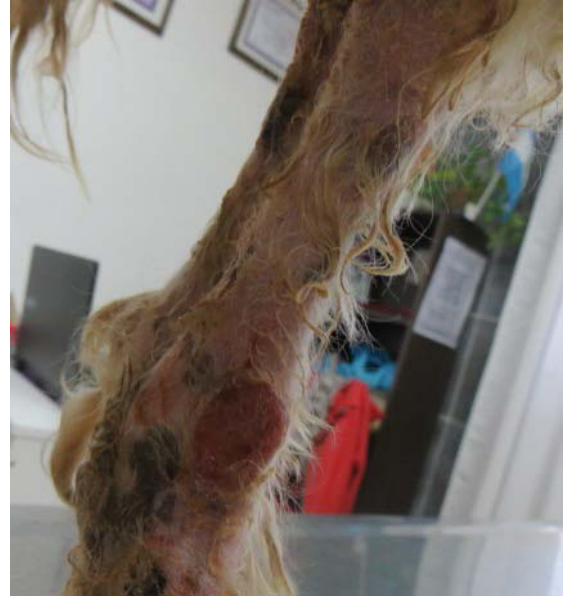
Miembros anteriores: excoriación, inflamación, nódulo ulcerado y costras.