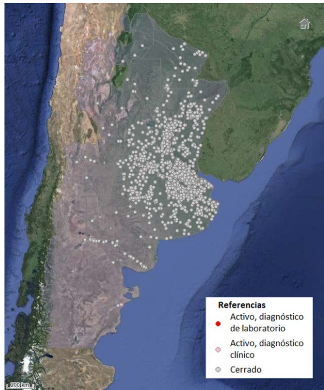
Brotes de encefalitis equina del Oeste en equinos. Argentina. Datos al 28 de abril de 2024.

Entre los casos confirmados, se registran hasta la fecha 10 fallecidos, en las provincias de Buenos Aires (5), Santa Fe (2), Córdoba (1), Entre Ríos (1) y Río Negro (1).