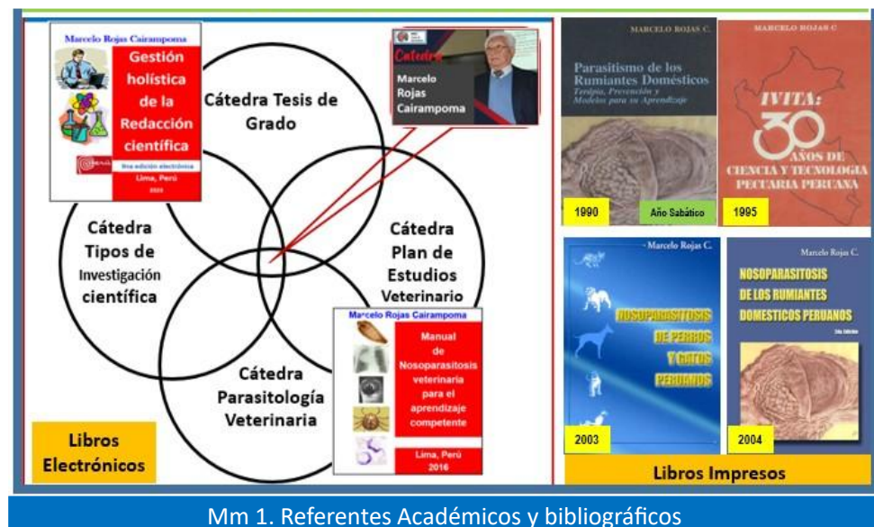
Mm 1. Referentes Académicos y bibliográficos