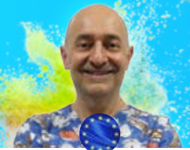
Miguel Ángel Valera Gestión