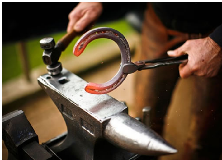
Figura 1. Binomio herrador-veterinario.

El carácter de ciencia aplicada al herrado, lo da la sistematización de conocimientos académicos del pie equino (anatomía, histología, fisiología, biomecánica, etc.) y que, tanto herrador como veterinario, deben tener. El arte en cambio, solo puede aportarlo el herrador ( Fig. 1 ), a través de la forja, el manejo de los distintos metales o materiales, forma de reparar cascos rotos, calidad, variedad y estado de sus herramientas, destreza con ellas, aspectos estéticos del trabajo terminado e incluso, el buen manejo del animal (paciencia, no violencia, etc.).