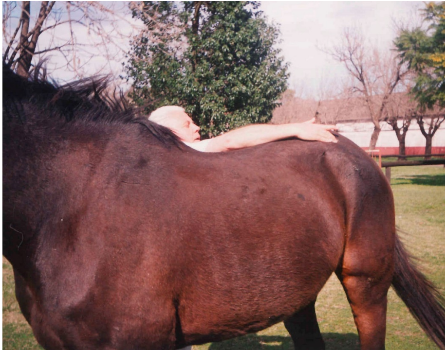
Figura 7: Algia alejada del pie.

Debe decirse asimismo que las lesiones, en general nunca son graves pero sí suficientes para afectar la mecánica (y manejo), alertar al jinete, demandar la intervención del veterinario y este resolverá; ello implica la posibilidad de necesitar al herrador para revertir lo alterado.