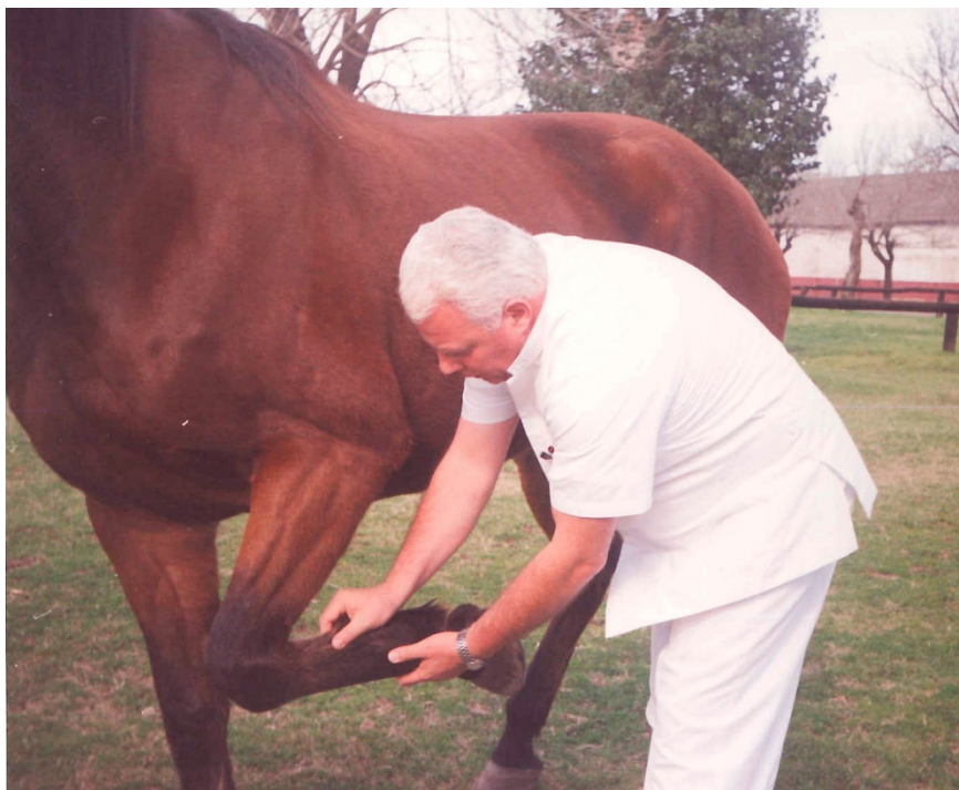
Figura 8: Las estructuras cercanas al pie, también se afectan.

Las estructuras cercanas al lugar del problema (tendones, ligamento suspensor del nudo, bridas, articulaciones podales, etc.), también pueden involucrarse y provocar dolor —no necesariamente con claudicación inmediata—, y el clínico debe evaluar minuciosamente y discernir entre la afección principal y las asociadas.