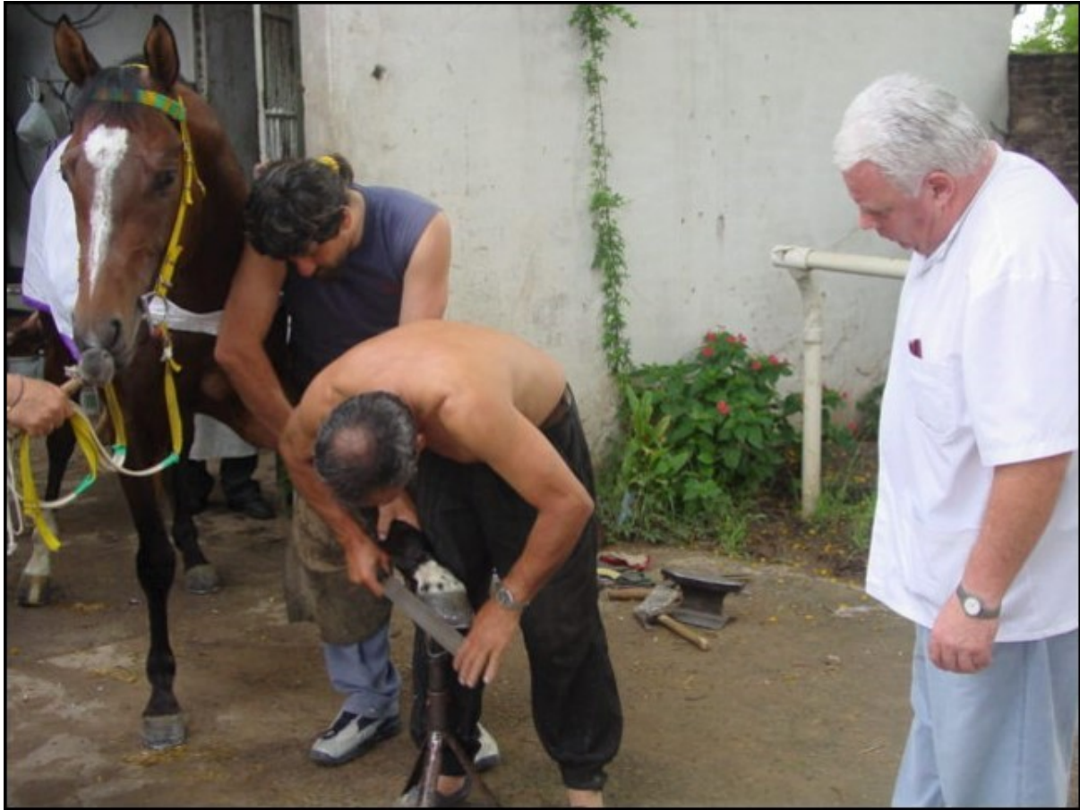
Figura 2. El herrador es un artesano con conocimientos científicos.

Lo dicho anteriormente, pone en evidencia la enorme importancia de los dos profesionales conformando un binomio de trabajo (que no necesariamente deben ser las mismas personas, ni todo el tiempo, aunque en algunos ámbitos ocurre y es muy beneficioso, como es el caso del militar o algunos clubes hípicos). En síntesis, no deben actuar por andariveles distintos; por eso dijimos que es una relación necesaria y obligada. Por lo tanto, es indispensable para la interacción, que los dos conozcan el pie.