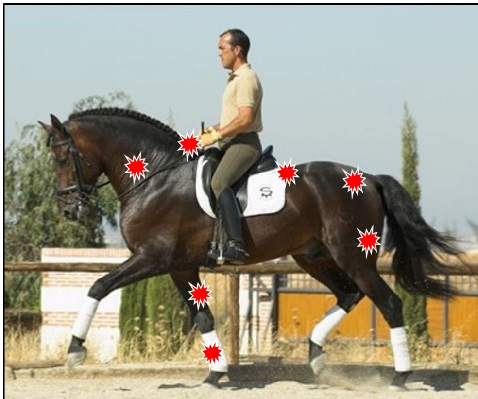
Figura 6: Molestias durante el trabajo.