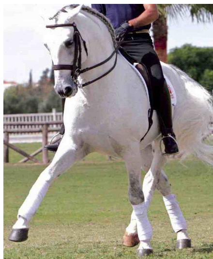
Figura 4. Algunos ejercicios no son realizados adecuadamente.

El herrador: por descuidar los aspectos básicos de balance de los pies, dejar desnivel entre miembros, talones muy bajos, asimétricos, etc., que llevan al desequilibrio del animal, con el cuadro clínico de disfunción mecánica y algias a distancias, alejadas de su lugar de origen (talones muy bajos, o asimetría entre un miembro y otro, por ejemplo), lo que en principio es “silencioso” hasta que deja de serlo cuando algunas estructuras musculares son asiento de distensiones, inflamación, contracturas, al asumir funciones (para las cuales no están diseñadas), en el intento de restablecer el equilibrio y además, por el gran sentido de cooperación del caballo; en determinado momento, la disfunción pone en alerta al jinete al percibir que el caballo no ejecuta bien determinados ejercicios de picadero u opone alguna resistencia, (flexibilidad comprometida, falta de soltura de movimientos), pudiendo manifestarlo con gestos y actitudes (por razones de tipo de trabajo, variedad de ejercicios, etc., esto es más visible o apreciable en disciplinas como salto, adiestramiento, prueba completa, o similares).