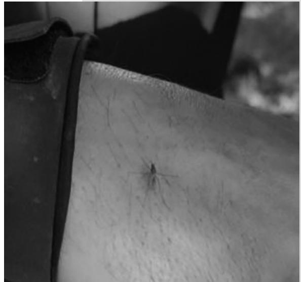
A. albifasciatus posado.

El Aedes albifasciatus es el vector descrito para la transmisión del virus de la Encefalitis Equina del Oeste. No se registraron casos de ésta última en la provincia de Tierra del Fuego.