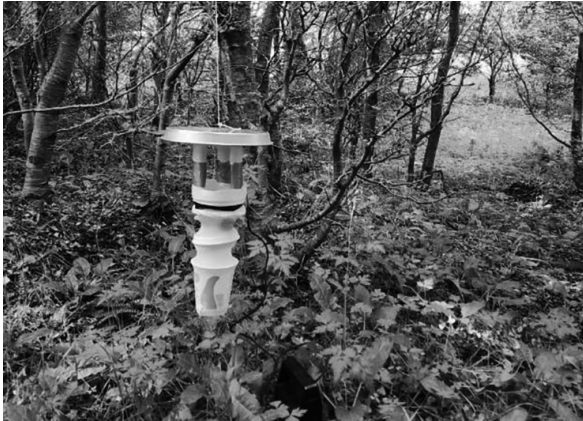
Trampas de luz CDC, caseras.