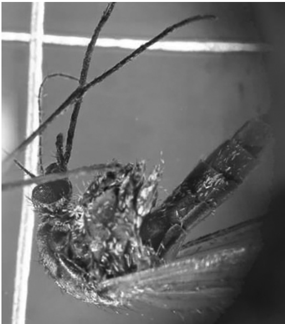
Aedes albifasciatus en lupa.

Hasta la fecha de elaboración del presente informe, se testearon 21 sitios, (Ilustración N° 1), obteniendo resultados satisfactorios al hallazgo del culícido. Los ejemplares recolectados fueron analizados y clasificados bajo claves taxonómicas específicas (Fotos N° 2) por profesionales de la Dirección de Salud Ambiental.