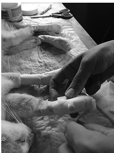
Puesto veterinario en CEA3, Mallín Ahogado.

el Maitén acuden a brindar sus servicios veterinarios tal cual lo vienen haciendo desde el trágico incendio de Golondrinas en 2021. Atrás de ellos se suman nuestros colegas de Esquel y alrededores como así también de San Carlos de Bariloche para, entre todos, llevar nuestra profesión a dónde más se necesita.