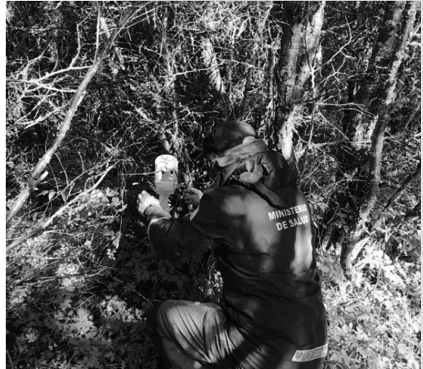
Colocación de trampas.

Las capturas fueron más eficientes en zonas de bosques jóvenes, con vegetación adaptada a posibles encharques. No se pudieron hallar en sitios descampados con influencia de vientos. (Foto N° 3 y 4)