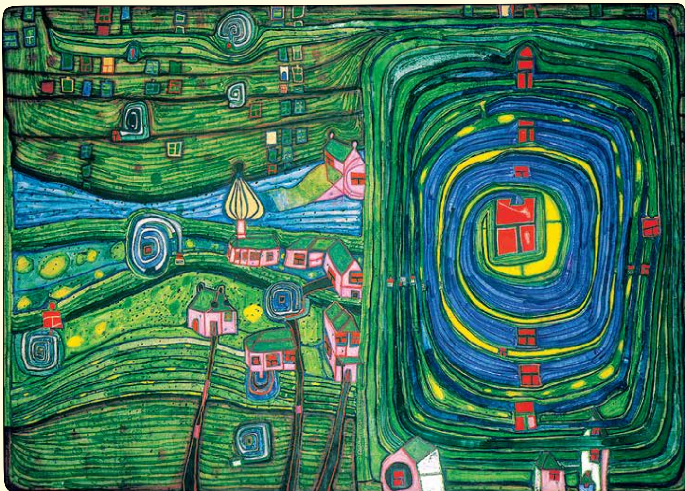
Friedensreich Hundertwasser, (738) Grass for those who cry, 1975, © 2013 NAMIDA AG, Glarus/Switzerland