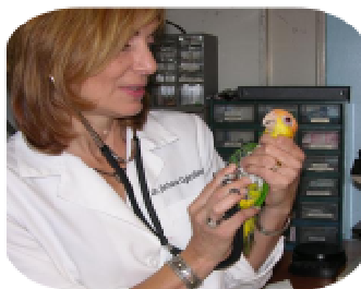
Fauna Silvestre y Enfermedades Trasmisibles